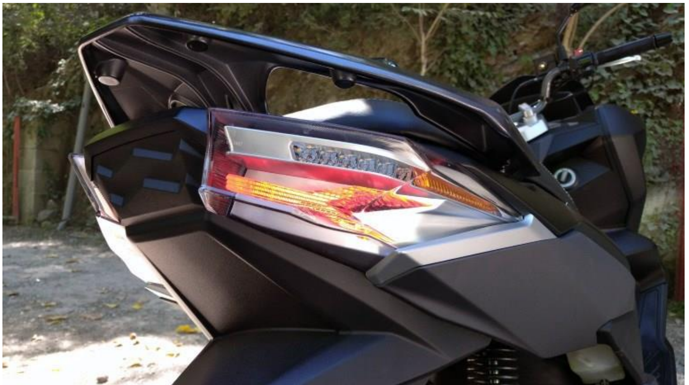
Ημιδιαφανές κρύσταλλο με LED μπάρα.